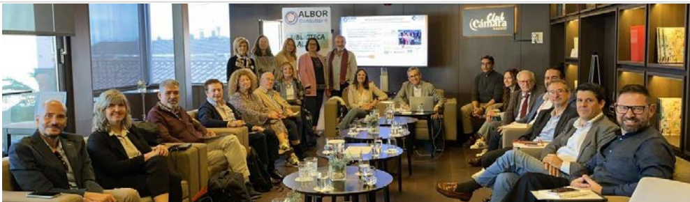
Encuentro oct. 2024. RED ALBOR

Consultoría sénior, gerontológica y de excelencia en gestión: Talento Sénior. Máster Gerontología y Atención Centrada en la Persona. Amigabilidad con personas mayores. Políticas públicas. Diálogo civil y político.